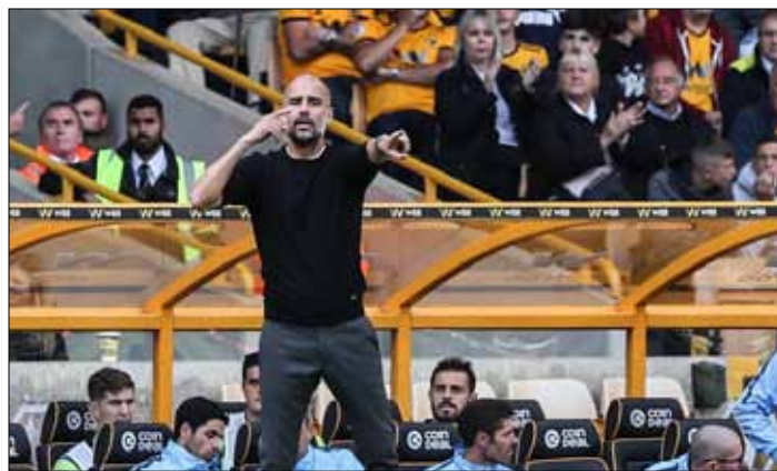
Drużyna prowadzona przez Pepa Guardioloę pokonała na własnym stadionie Newcastle United 2:1

Z drugich zwycięstw w sezonie cieszyły się natomiast uznane firmy, jak Arsenal Londyn (na wyjeździe z Cardiff 3:2) i Manchester United (2:0 z Burnley na jego boisku). □