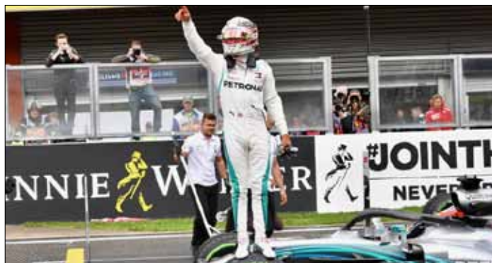
Lewis Hamilton z Mercedesa wygrał na torze Monza wyścig Formuły 1 o Grand Włoch, 14. rundę mistrzostw świata

Po raz kolejny nie udało się kierowcy Ferrari zwyciężyć w domowym wyścigu na Monzie, choć Raikkonen i Niemiec Sebastian Vettel (obaj Ferrari) startowali z pierwszej linii. Swoje pozycje utrzymali tuż po starcie, ale już na czwartym zakręcie fani Ferrari zamarli, gdy Hamilton bezpardonowo zaatakował Vettela. Między samochodami obu kierowców doszło do kontaktu, w bolidzie Vettela uszkodzone zostało przednie skrzydło. Hamilton