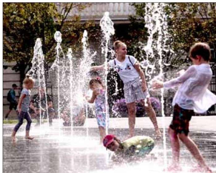
Ochłodzić się w upalne dni pomaga kąpiel w fontannie