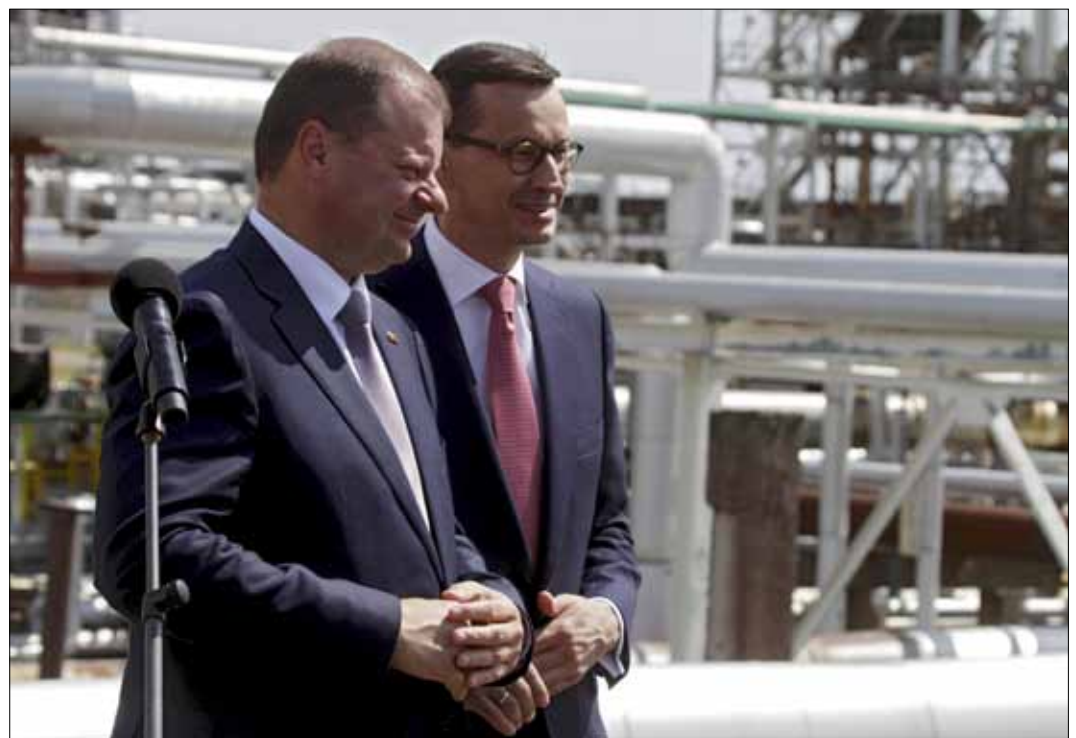
Premierzy Polski i Litwy spotkali się w rafinerii w Możejках

Opr. I. L. na podstawie: PAP i premier.gov.pl