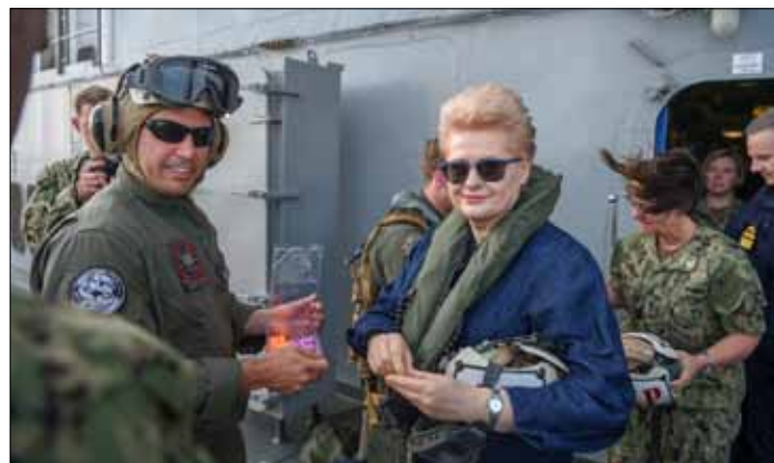
Prezydent Dalia Grybauskaitė obserwowała ćwiczenia „Baltops 18” ze statku sił morskich USA