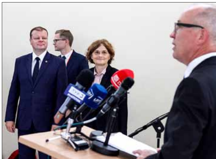
Uroczystej inauguracji nadawania polskiej TV dokonali w środę premier Saulius Skvernelis i ambasador RP na Litwie Urszula Doroszewska