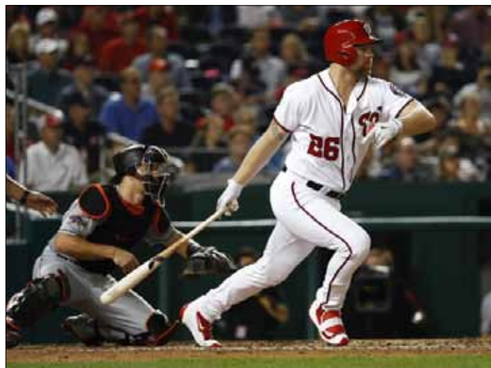
W czerwcu przyszłego roku na London Stadium – zmierzą się drużyny New York Yankees i Boston Red Sox

Według medialnych spekulacji Khan myśli długoterminowo nawet o przeniesieniu Jaguars do Londynu, co miałyby być jednym z głównych powodów, dla których półtora tygodnia temu złożył