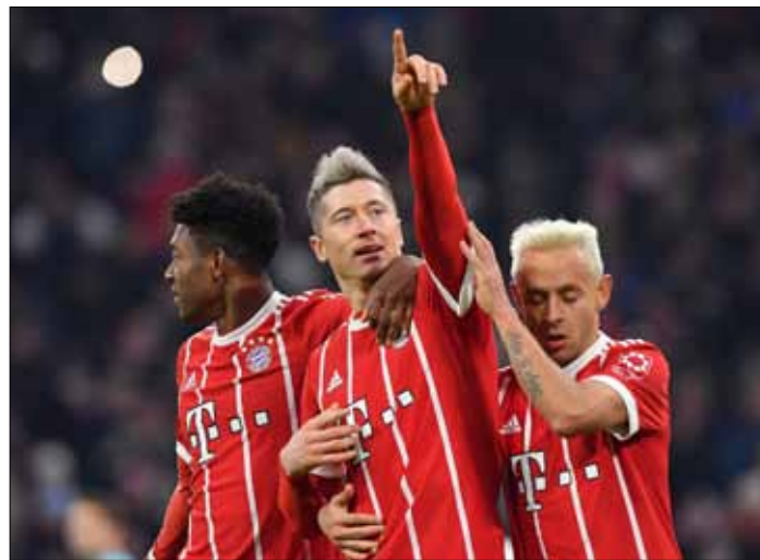
Innym potencjalnym kierunkiem dla polskiego napastnika (Roberta Lewandowskiego – pośrodku) jest Premier League