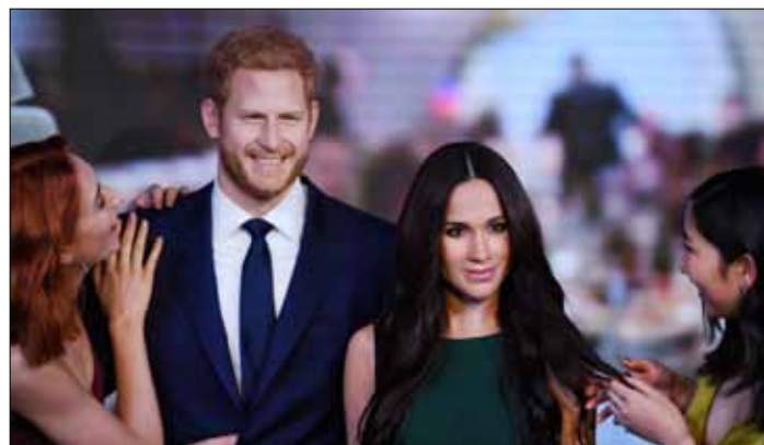
W Muzeum Figur Woskowych Madame Tussauds w Londynie odsłonięto figurę narzeczonej księcia Harry'ego, Meghan Markle