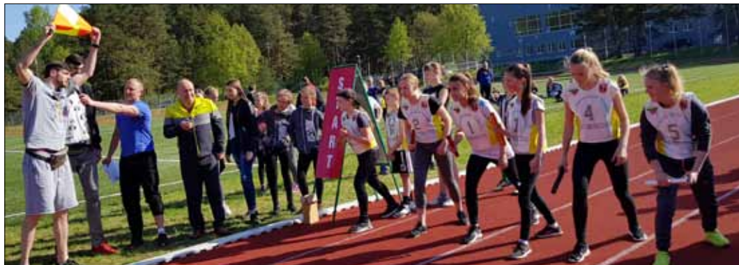
Program zawodów składał się z biegów sztafetowych i biegów indywidualnych