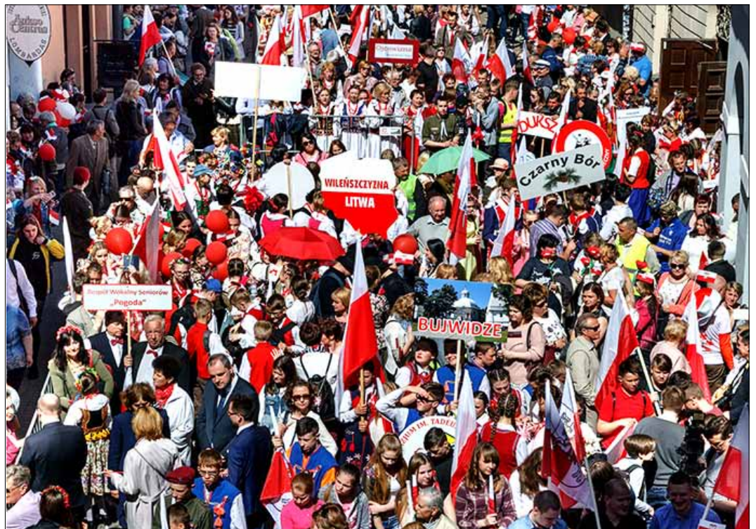
Wielotysięczny tłum właściwie zalał wileńską Starówkę biało-czerwonymi barwami