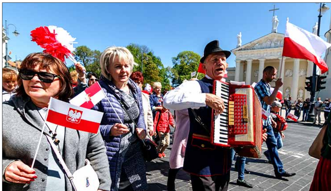
Przemarsz był wspaniałą deklaracją polskości i przywiązania do narodowych tradycji