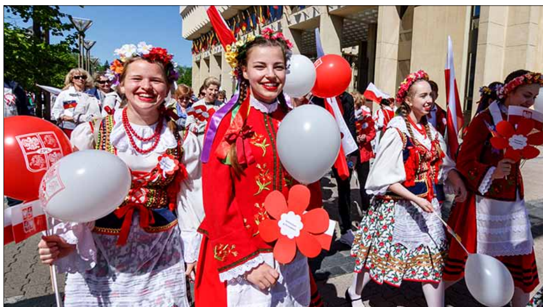
Wśród uczestników pochodu widać było tłumy młodzieży