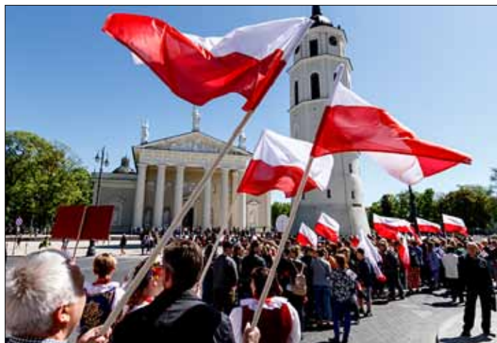
Pochód rozpoczął się przed gmachem Sejmu RL, przeszedł aleją Giedymina pod katedrę, a dalej do Ostrej Bramy

Ilona Lewandowska