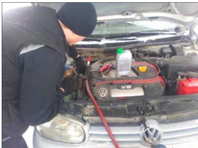
Świadomi kierowcy wiedzą o higroskopijnych właściwościach płynu hamulcowego

Nie przez przypadek wiele starszych samochodów miewa problemy z zacinającym się termostatem czy ogrzewaniem. Wytrącające się osady, w połączeniu z krążącymi w układzie