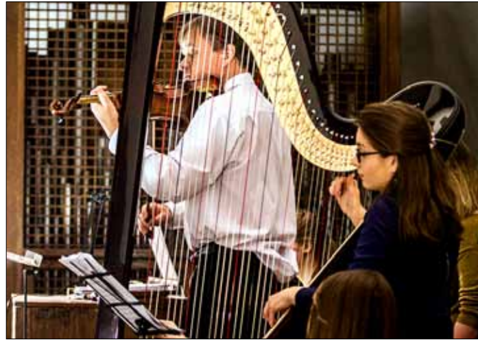
Wykonano wirtuozersko najpiękniejsze wersje pieśni „Ave Maria” oraz utworu „Cztery pory roku” Antonio Vivaldiego.

– Dlatego tak bardzo zależy nam na wybudowaniu stacjonarnego hospicjum, które będzie wyposażone w specjalistyczny sprzęt, a jednocześnie