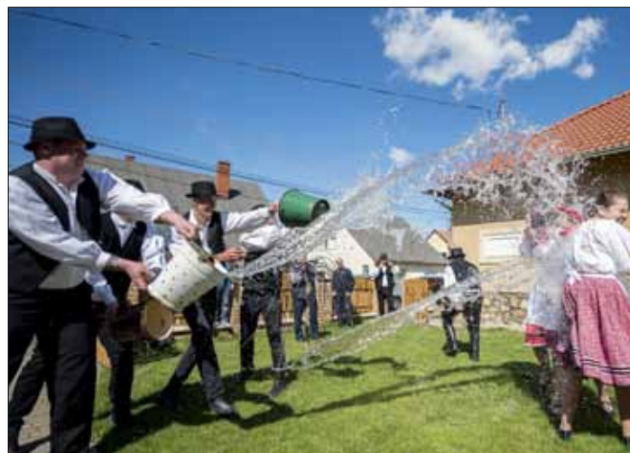
Na Węgrzech – według tradycji wielkanocnych – polewa się dziewczyny wodą