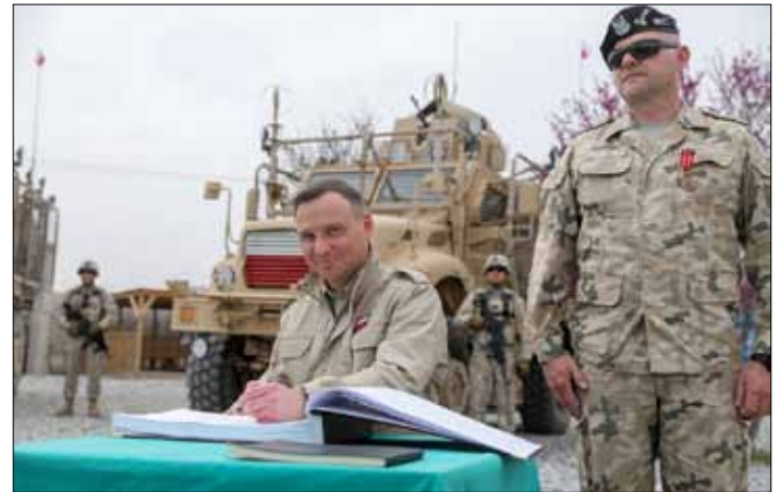
Wizyta Andrzeja Dudy, prezydenta RP w Polskim Kontyngencie Wojskowym RSM Afganistan