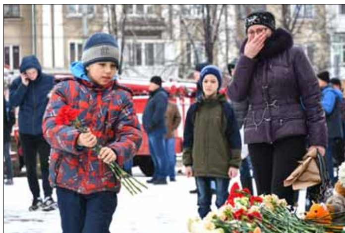
Większość ofiar strasznego pożaru w Kemerowie to dzieci, które przyjechały całymi klasami do kina

– Wówczas najważniejsze jest pamiętać, żeby nie ulec panice. Zdarza się, że podczas pożaru zanika elektryczność, wtedy powinniśmy ostrożnie poruszać się po ciemku w stronę wyjść ewakuacyjnych, które będą oświetlone, nawet gdy w całym gmachu nie będzie prądu. Najważniejsze to pamiętać, aby nie zatrzymywać się i nie poruszać się w kierunku prze-