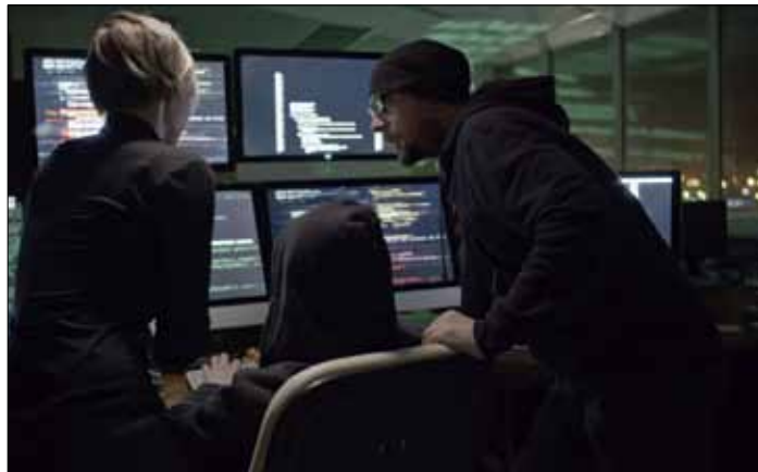
Wirtualna przestrzeń stwarza potencjalne zagrożenie dla naszych interesów