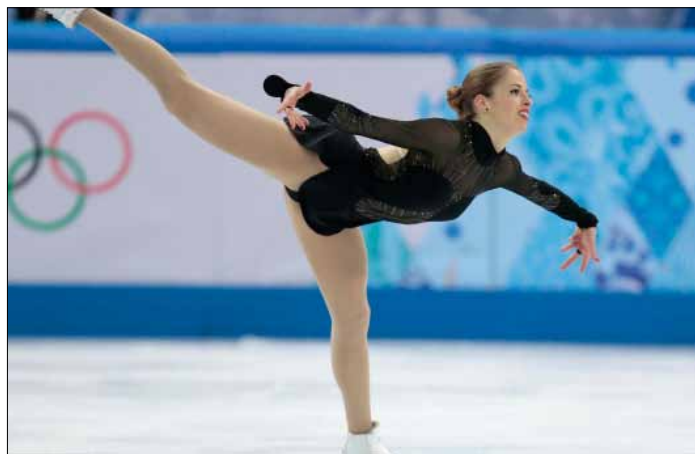
31-letnia Kostner zebrała wiele pochwał za występ

W programie dowolnym zaprezentują się 24 solistki i 16 par sportowych. Do mistrzostw zgłoszono 192 zawodników z 43 krajów, w tym po 37 solistek i solistów, 31 par tanecznych i 28 sportowych. □