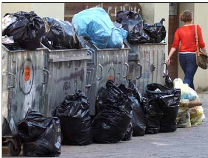
Dwie trzecie odpadów plastikowych trafiają na śmietniska lub są spalane

„Plastik zaśmieca i zanieczyszcza nasze środowisko. Dwie trzecie odpadów są spalane lub trafiają na śmietniska, zaś trzecia część – do naszego środowiska. Ważny jest tutaj również aspekt gospodarczy. Chodzi o to, że większość produktów plastikowych używana jest tylko jeden raz, przez co tracą one aż do 95 procent swojej wartości. Unia Europejska z tego powo-