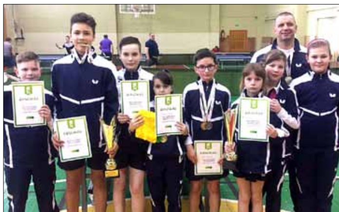
Triumfatorzy z Mickun

Ekipa tenisistów z Mickun również triumfowała w rozgrywkach. Chłopcy pokonali rywali z Gimnazjum w Pakražantis (Kelmės r.) (3:0), ze Szkoły