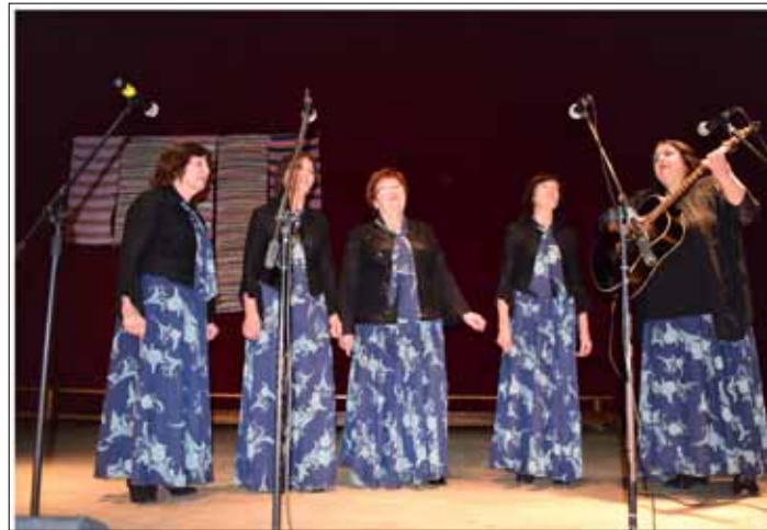
Wspólne śpiewanie, serdeczne brawa, chwile wzruszenia nie miały końca