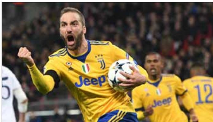
Liga Mistrzów: Tottenham Hotspur na moment stracił czujność i pożegnał się z rozgrywkami

Kilkadziesiąt sekund później Son już się nie pomylił. Po podaniu Kierana Trippiera Kореаńczyk pokonał leżącego na murawie Buffona. W pierwszej połowie nie obyło się bez kontrowersji sędziowskich (w Lidze Mistrzów nie ma możliwości skorzystania z systemu VAR). Najpierw w polu karnym Juventusu ręką zagrał Giorgio Chiellini, ale Marciniak nie podyktował „jedenastki”. Później polski