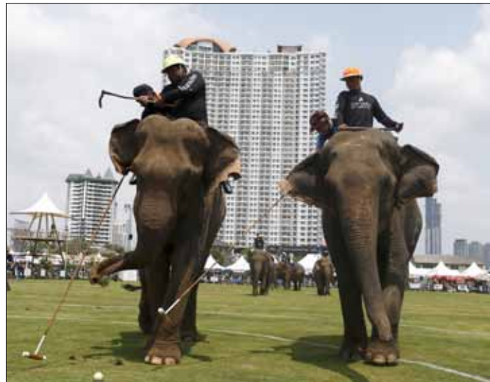
W Tajlandii odbywa się turniej gry w polo na słoniach