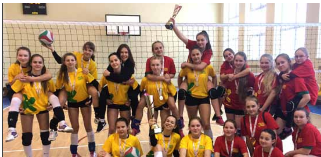
Siatkarki z Gimnazjum w Awizeńniach wywalczyły złote krążki podczas Igrzysk Szkół Litwy wśród Szkół Wiejskich

Waldemar Szumski szkoleniowiec siatkówki dziewcząt Szkoły Sportowej Samorządu Rejonu Wileńskiego