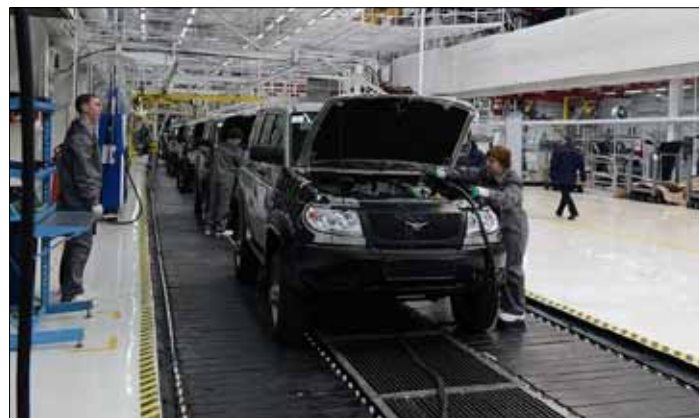
Jedynym sensownym rozwiązaniem jest w takim przypadku regeneracja reflektora

Uszkodzenie odbłyśnika objawia się przeważnie jego matowieniem. Z czasem matowy obszar, który przyjmuje początkowo formę niewielkiej plamki, wyraźnie się powiększa. Zjawisko przyspiesza ponadto montaż „silniejszych” żarówek, które często emitują zdecydowanie więcej ciepła niż stosowane fabrycznie. W takim przypadku nie może być mowy o jakiegokolwiek „naprawie punktowej”