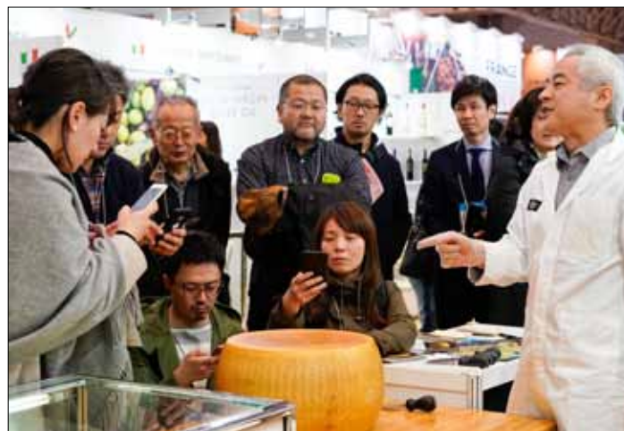
W Japonii rozpoczęły się 43. targi artykułów spożywczych i napojów FOODEX