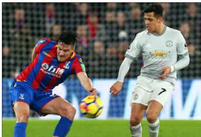
Manchester United pokonał na wyjeździe Crystal Palace 3:2, choć przegrywał już 0:2

O zwycięstwie gości zdecydował silny strzał z woleja sprzed pola karnego Serba Nemanji Matica już w doliczo-