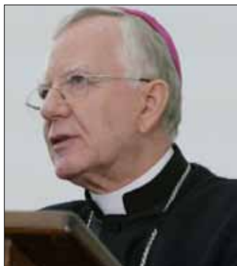
Abp Marek Jędraszewski

– Nie ma nic wspanialszego dla człowieka niż mieć udział w świętości samego Boga i dlatego pochylmy nasze głowy przed Bogiem, wierzy w Ewangelię i nawracajmy się! – zakończył arcybiskup krakowski. □