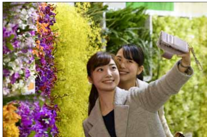
W Tokio rozpoczął się tradycyjny międzynarodowy festiwal orchidei