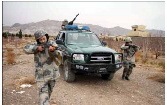
W Afganistanie odbywają się ćwiczenia funkcjonariuszy policji granicznej