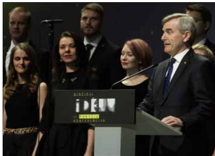
Viktoras Pranckietis cieszył się, że społeczeństwo poruszyło temat podwójnego obywatelstwa jako priorytet

Z kolei Skvernelis podkreślił, że obie idee, które zdobyły jednakową liczbę głosów – wsparcie dla rodzin i zmniejsze-