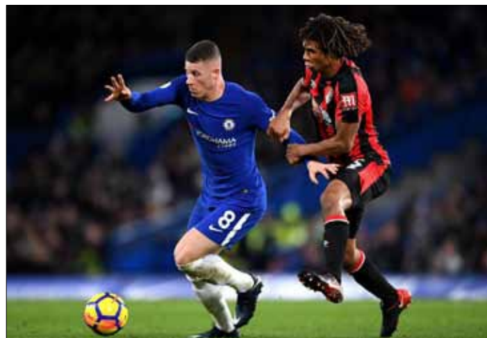
Chelsea Londyn przegrała u siebie z Bournemouth aż 0:3 w 25. kolejce angielskiej ekstraklasy piłkarskiej