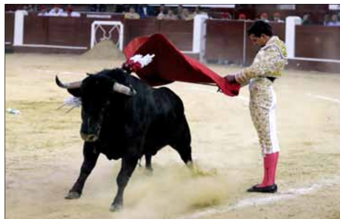
Walka matodora z bykiem w Kolumbii