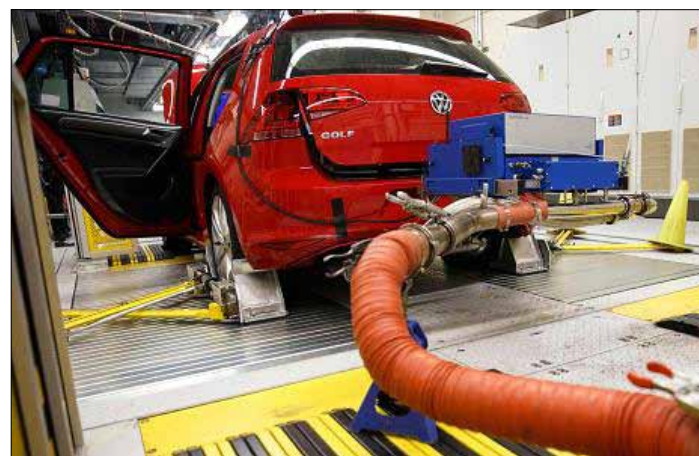
Małpy były zamykanych w uszczelnionym pomieszczeniu, w którym musiały przez cztery godziny wdychać spaliny

Jeszcze w sobotę niemieckie firmy VW, BMW i Daimler zgodnie oświadczyły, że nie знаły szczegółów badań i potępiły testy na zwierzętach jako nieetyczne, a Bosch zapewnił, że wystąpił z grupy