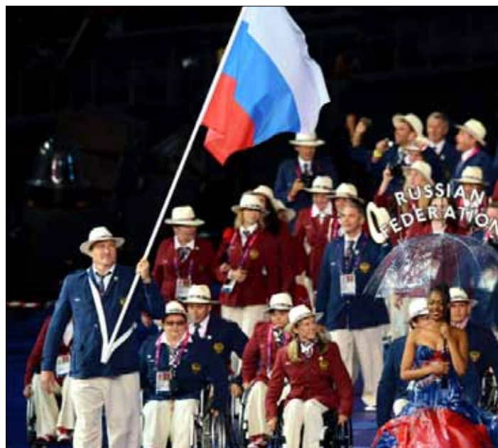
IPC spodziewa się, że w Korei Płd. wystartuje na tych zasadach 30-35 sportowców niepełnosprawnych z Rosji