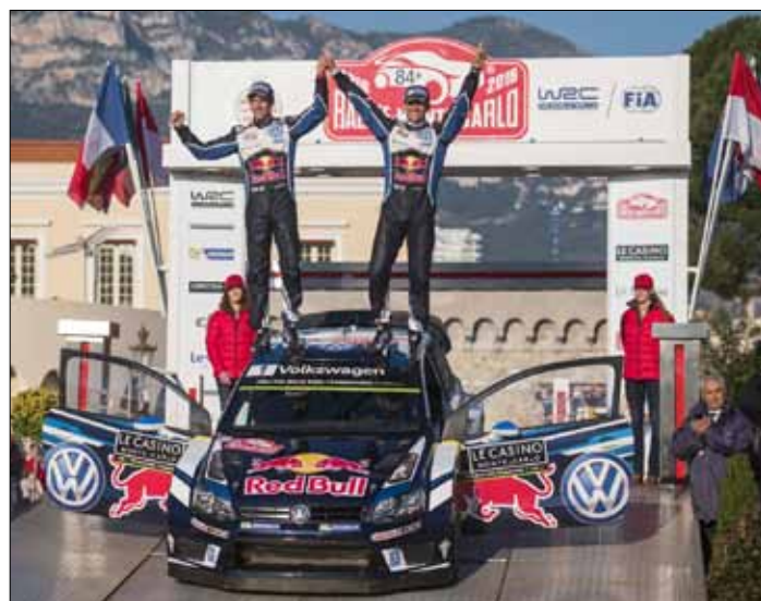
Tytułu wywalczonego już pięć razy z rzędu będzie bronił Francuz Sebastien Ogier

Rekordzistą wśród walczących o tytuły mistrza świata jest dziewięciokrotny triumfator Francuz Sebastien Loeb, który wygrał tu siedmiokrotnie. O samodzielne drugie miejsce w klasyfikacji wszech