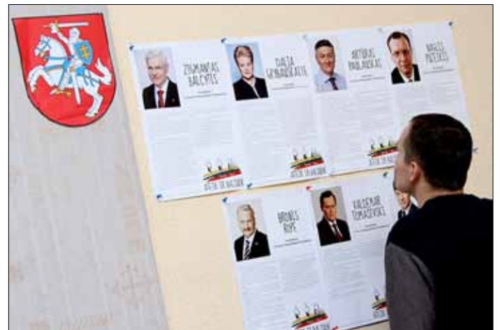
Na razie do udziału w kampanii prezydenckiej zgłosiło się dwóch kandydatów