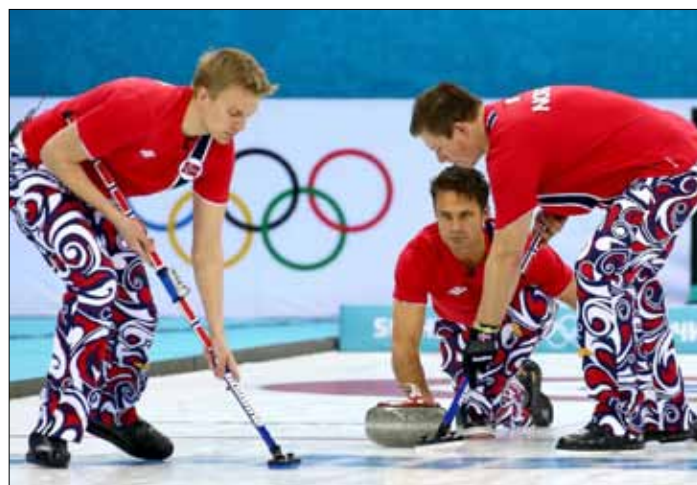
W historii zimowych igrzysk olimpijskich Norwegia zajmuje pierwsze miejsce w tabeli medalowej

„Teraz naszym celem jest pobicie rekordu Kanady w ilości złotych medali, która zdobyła ich 14 w 2010 roku w Vancouver” – skomentował Kaggstad. □