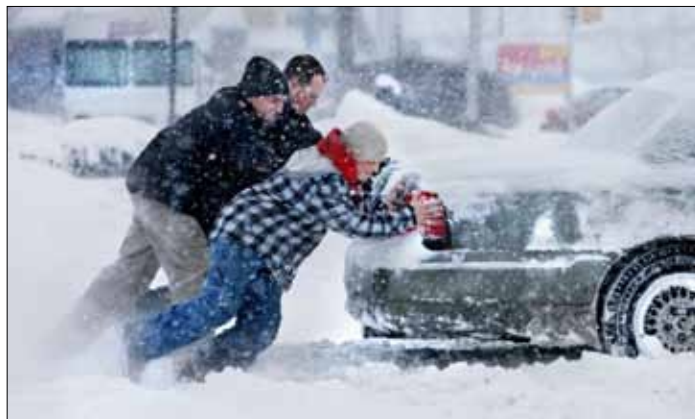
Właściciele Diesla powinni wyjątkowo mieć się na baczności w czasie zimy

paliwo jest często trudne do zlokalizowania. Sprawdzone, choć długotrwałym sposobem jest odstawienie auta do ogrzewanego garażu. Niestety takie odmrażanie zabiera o wiele więcej czasu. Zdecydowanie lepiej sprawdza się stosowanie dodatków do paliw, wiążących wodę. Warto również tankować na renomowanych stacjach paliw, gdzie szansa na spotkanie paliwa złej jakości jest mniejsza. Zapobiegaj, zamiast leczyć. Sprawne usuwanie skutków zamarzania jest proste. Wystarczy dodatki do paliwa, które wlane do zbiornika przy okazji tankowania zmniejszą ryzyko wystąpienia większej