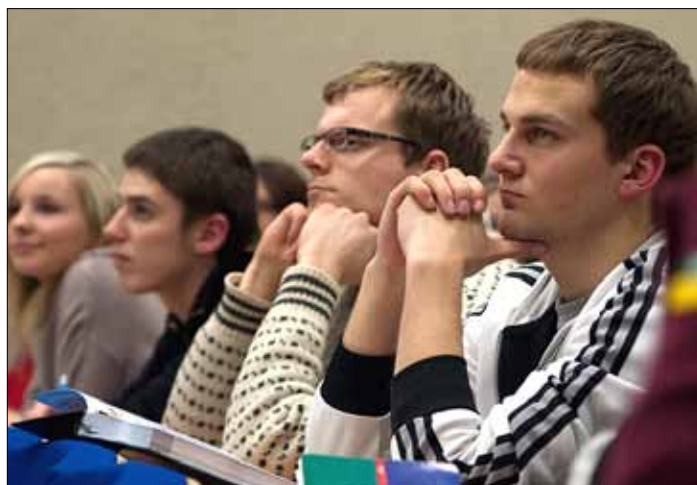
Podczas spotkania z przedstawicielami NAWA osoby zainteresowane będą mogły zadać pytania dotyczące studiów w Polsce

– Tam kandydaci będą wypełniali wniosek i przesyłali wymagane skany dokumentów wraz z ich tłumaczeniami. Pozytywny wynik oceny formalnej dokumentów w systemie NAWA będzie warunkiem dopuszczenia do kolejnego etapu – oceny merytorycznej, czyli egzaminów, które, jak co roku, będą organizowane