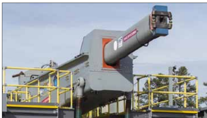
Podczas testów railgun wystrzeliwał średnio 4,8 pocisku na minutę zamiast wymaganych 10