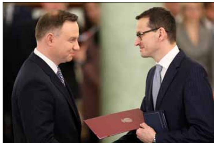
Prezydent Andrzej Duda pogratulował premierowi Morawieckiemu, po tym jak jego rząd otrzymał w Sejmie wotum zaufania

Prezydent Andrzej Duda pogratulował premierowi Morawieckiemu, po tym jak jego rząd otrzymał w sejmie wotum zaufania. Życzył też