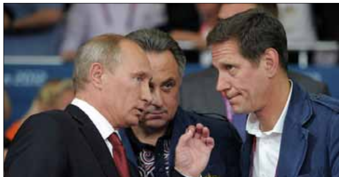
Prezydent Rosji Władimir Putin, były minister sportu Witalij Mutko i prezes Rosyjskiego Komitetu Olimpijskiego Żukow

Ustalono jednak, że niektórzy reprezentanci tego kraju będą mogli startować pod flagą olimpijską, ale w relacjach nie będzie można używać oficjalnej nazwy państwa.