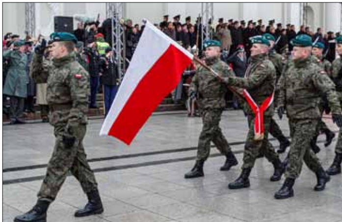
W paradzie wojskowej wzięli udział polscy żołnierze z brygady LITPOLUKRBRIG