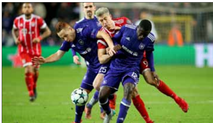
Obroncy Anderlechtu próbują powstrzymać Roberta Lewandowskiego, który jednak strzelił gola

W środowy wieczór Lewandowski mógł znacznie poprawić swoje osiągnięcie. Do końca meczu miał jeszcze kilka znakomitych okazji. M.in. dwukrotnie – w 58. i 85. minucie – nie wykorzystał sytuacji sam na sam z bramkarzem Anderlechtu. Nie dał rady pokonać go również