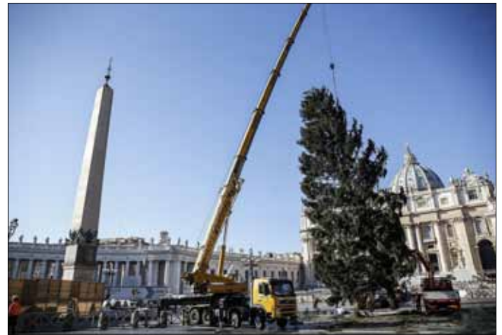
Na placu Świętego Piotra ustawiono wczoraj choinkę z Polski. Została przywieziona do Watykanu na specjalnej platformie