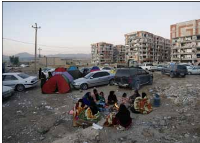
Przy granicy z Irakiem zniszczonych zostało osiem wiosek, a wiele innych zostało odciętych od elektryczności

datkowe ekipy ratunkowe. Na miejscu pracuje już 35 grup. Prezydent Iranu i zarazem szef irańskiego rządu, Hasan Rowhani, który odbył pilną rozmowę telefoniczną z ministrem spraw wewnętrznych, zaapelował o maksymalne wzmoczenie wysiłków na rzecz usuwania skutków kataklizmu i ratowania ofiar. ◻