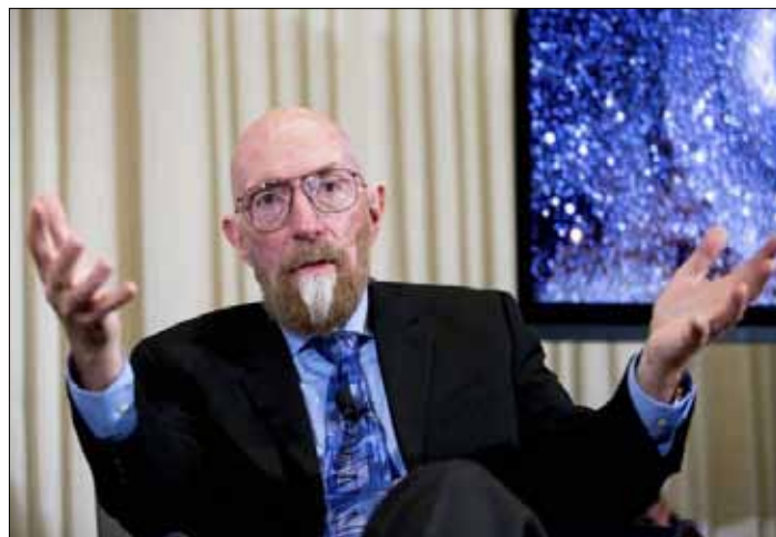
77-letni prof. Kip Stephen Thorne, zajmuje się fizyką teoretyczną i jest związany z Kalifornijskim Instytutem Technologicznym