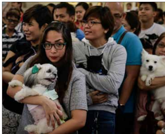
W dniu św. Franciszka z Asyżu – patrona zwierząt, w kościołach Manili tradycyjnie święcono zwierzęta domowe