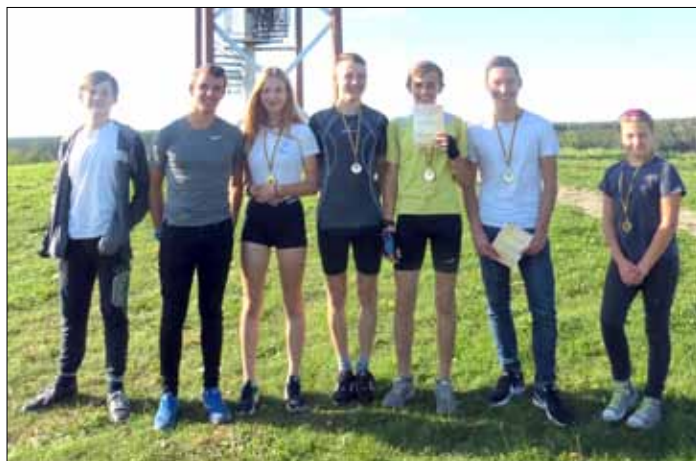
Wychowankowie Szkoły Sportowej Samorządu Rejonu Wileńskiego z Niemenczyna ze starszej grupy wiekowej

Sylwia na pierwszym strzelaniu była bezbłędna. Na drugim popełniła 3 błędy i zajęła 1. miejsce z wynikiem 16 min. 04 sek.