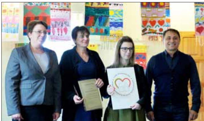
Nagroda za najlepsze logo powędrowała do maturzystki z Gimnazjum im. Anny Krepsztul w Butrymańcach