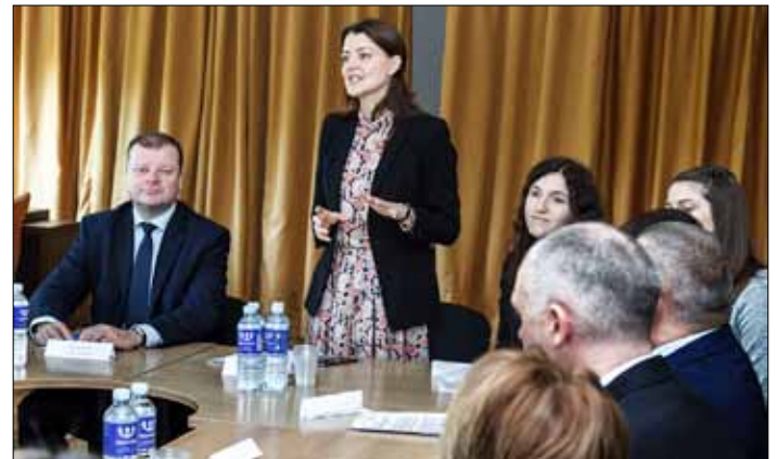
Podczas piątkowej dyskusji mieszkańcy Nowej Wilejki rozmawiali z premierem o problemach swej dzielnicy

– Nowa Wilejka jest unikalną dzielnicą, posiadającą