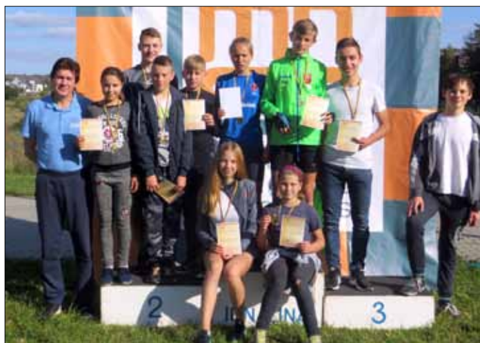
Wychowankowie Szkoły Sportowej Samorządu Rejonu Wileńskiego z Niemenczyna z młodszej grupy wiekowej