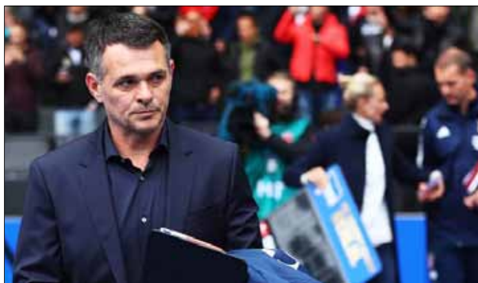
Tymczasowy szkoleniowiec Bayernu Willy Sagnol nie potrafił doprowadzić ich do zwycięstwa

Oprócz rozczarowania drugim remisem z rzędu w Bundeslidze, po którym strata do prowadzącej w tabeli Borussia Dortmund urosła już do pięciu punktów, niepokojące wieści dobiegały po meczu z szatni Bayernu. Powo-