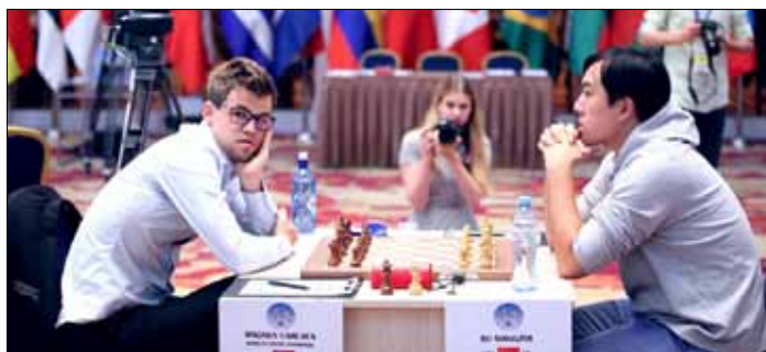
Po dwóch zwycięstwach Norweg Magnus Carlsen niespodziewanie został pokonany przez Chińczyka Xiangzhi Bu

Pula nagród turnieju w stolicy Gruzji, który potrwa do 28 września, wynosi 1,6 mln dolarów. Zwycięzca otrzyma 120 tys. □