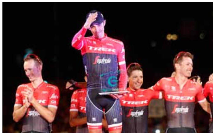
Słynny hiszpański kolarz Alberto Contador, który kończy karierę odebrał nagrodę dla najbardziej walecznego kolarza

Contadorowi do podium zabrakło 27 sekund. W niedzielę dojechał do mety siedem sekund za pierwszą grupą z podzielone-