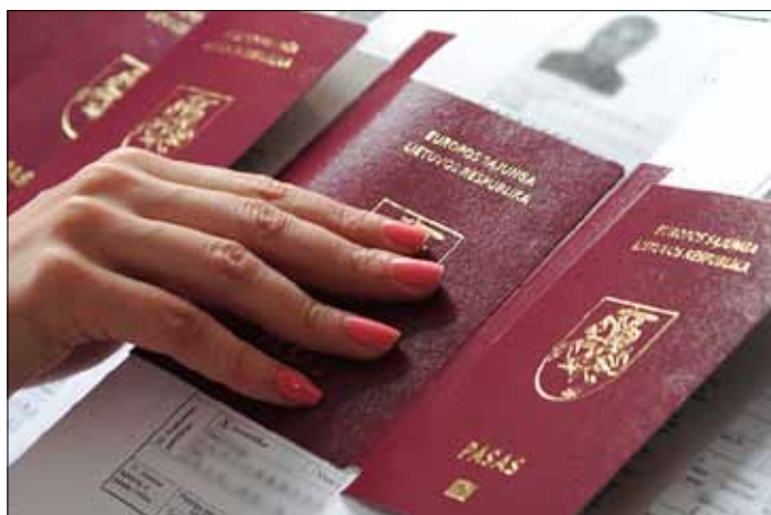
W maju komisja językowa wypowiedziała się za pisownią nazwisk w oryginale na głównej stronie dokumentu