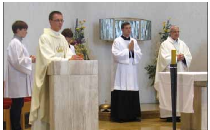
Relikwie I stopnia św. Jana Pawła II i św. Kazimierza na stole prezbiterialnym