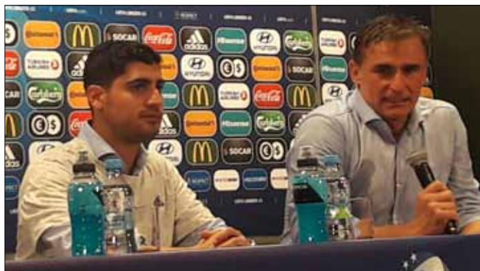
Z prawej trener reprezentacji Niemiec Stefan Kunz

Hiszpanom na osłodę pozostały tytuły indywidualne ich zawodników. Dani Ceballos został wybrany najlepszym piłkarzem mistrzostw. Saul Niguez zdobył złotego, a Marco Asensio srebrnego buta w klasyfikacji najlepszych strzelców. Turniej okazał się dużym sukcesem organizacyjnym. Na sześciu polskich stadionach zasiadło prawie ćwierć miliona kibiców. Średnia frekwencja na meczu wyniosła 11 623 widzów, co jest najlepszym osiągnięciem od 10