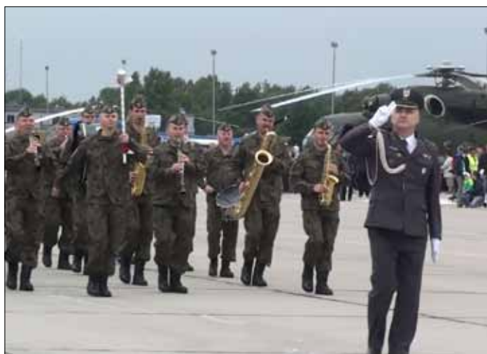
Orkiestra zagrała na lotnisku

Podczas uroczystej zbiórki całego stanu osobowego 21. BLT, zostały wręczone nominacje na wyższe stopnie, na-