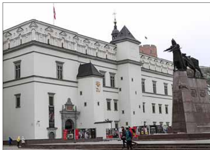
Z okazji Dnia Koronacji Króla Mendoga szereg imprez odbędzie się w Pałacu Władców w Wilnie

Wstęp wolny. 6 lipca ekspozycję muzealną można będzie obejrzeć w godz. 10–21, cena biletu wyniesie zaledwie 1 euro. W ciągu całego dnia będą czynne m.in. warsztaty twórcze dla dzieci i dorosłych. □