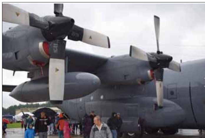
Samolot zrobił wrażenie na ludziach

– Z mężem przyjechalśmy ze Szczecina na pokazy lotnicze, a szczególnie na kołduny. Wie pan, to taki sam smak i klimat, jaki robiła moja mama. My pochodzimy z Wilna. Boże, jaka ja jestem szczęśliwa! Ta impreza w Świdwinie przypomina mi moje dzieciństwo. Chcę podziękować dowództwu bazy lotniczej, staroście świdwińskiemu, „Kurierowi