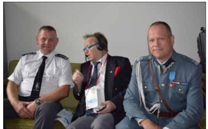
Również i nam podziękowali gospodarze, dowództwo jednostki, generałowie