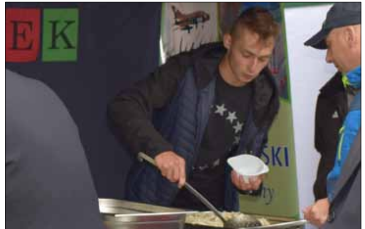
Zebrani byli karmieni kaszą