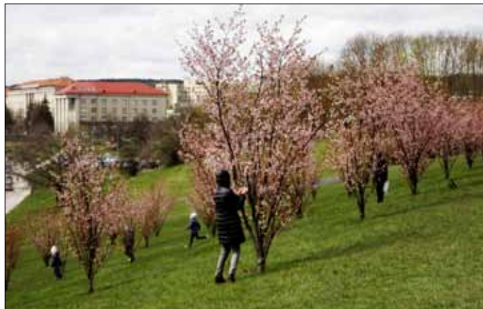
W Wilnie, na prawym brzegu Wilii w pobliżu Białego Mostu, zaczyna kwitnąć japońskie wiśnie — sakury