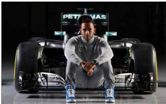
Lewis Hamilton powalczy 15 kwietnia w Bahrajnie o siódme kolejne pole position

„Choć nie jeździmy koło w koło, cieszę się, że się ścigamy. Czasem on był szybszy, czasem ja. Prezentujemy chyba równy poziom. To daje dużo frajdy” — ocenił Niemiec. 29-letni Vettel wywalczył cztery tytuły mistrzowskie w latach 2010-13. O dwa lata starszy Hamilton zdobył trzy trofea — w 2008 roku w barwach zespołu McLaren-Mercedes oraz w latach 2014-15 w obecnym teamie. □