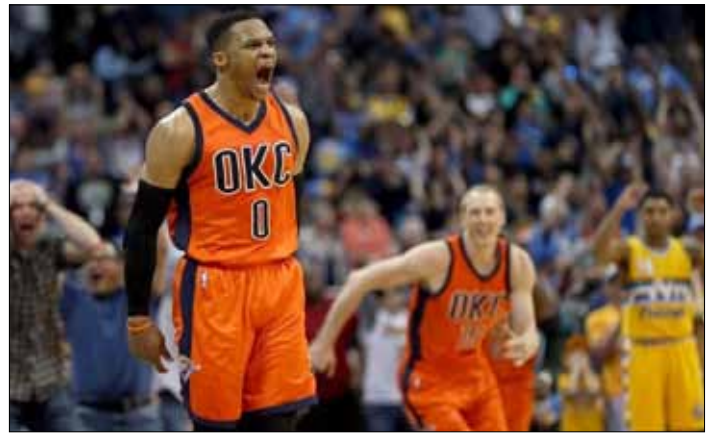
Russell Westbrook zaliczył 42. triple-double w sezonie. To najlepszy wynik w historii NBA

Minionej nocy miał 50 pkt, 16 zbiórek i 10 asyst. Kiedy prawie 5 minut przed koń-