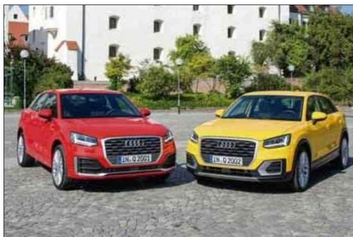
Polacy na dobra luksusowe wydali w ub. r. około 16,4 mld zł, w tym połowę na samochody

Miliardy na luksus. Polacy na dobra luksusowe wydali w ub. r. – według jego szacunków – 16,4 mld zł, w tym połowę na samochody. Na odzież przeznaczyli 2,2 mld zł, na spa i hotele 1,6 mld zł, na nieruchomości 1,2 mld zł, po 0,7 mld zł na meble i alkohole. Luksusowy samochód w polskiej skali to pojazd kosztujący co najmniej 215 tys. zł, ekskluzywne wakacje wyceniane są na co najmniej 7,2 tys. zł, zegarek na 6,1 tys. zł, torebka – 1,9 tys. zł. Butelka alkoholu, aby znaleźć się w tej kategorii, powinna kosztować co najmniej 350 zł. Przedstawiciel KPMG uważa, że popyt na dobra luksusowe w Polsce będzie szybko rósł. Spodziewa się, że w 2020 roku liczba zarejestrowanych aut sięgnie 63,5 tys., o 21 proc. więcej niż w 2016 roku. Sądząc po pierwszych dwóch miesiącach roku, prognoza spełnia się całkowicie. Dane Polskiego Związku Przemysłu Motoryzacyjnego wskazują, że liczba rejestracji Mercedesa powiększyła się o blisko 35 proc., BMW o