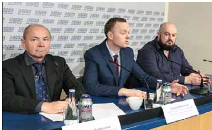
Związkowcy oskarżają samorząd o nieprzejrzystość w sprawie organizacji przetargu na świadczenie usług

Zdaniem przedstawicieli związków zawodowych, jeżeli obie części przetargu wygrają