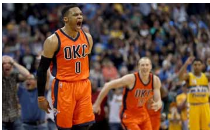
Russell Westbrook zaliczył 42. triple-double w sezonie. To najlepszy wynik w historii NBA

Minionej nocy miał 50 pkt, 16 zbiórek i 10 asyst. Kiedy prawie 5 minut przed koń-