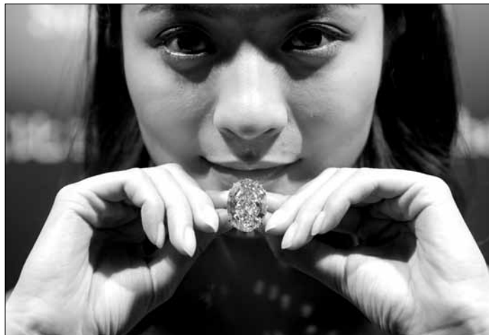
Na aukcji w Hongkongu zostanie wystawiony na sprzedaż najdroższy diament na świecie „Pink Star” („Różowa Gwiazda”)