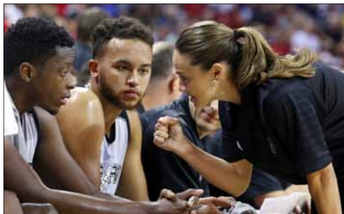
Hammon latem 2016 poprowadziła, jako pierwsza kobieta, samodzielnie „Ostrogi” i wygrała turniej w Las Vegas

„Nie ma żadnego fizycznego powodu, by panie nie mogły działać w lidze NBA na różnych płaszczyznach. Moim celem jest to, by zwiększyć pulę kandydatek, które mogłyby aspirować do prowadzenia meczów w roli sędziego” — dodał Silver. □