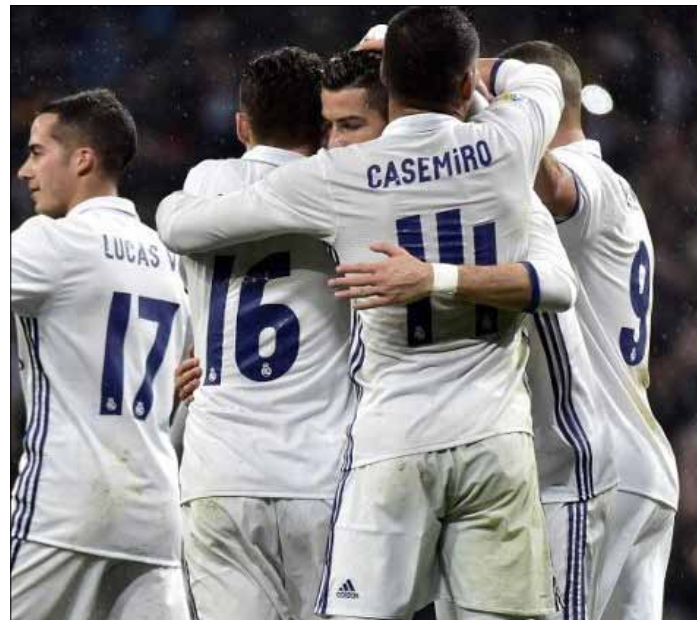
W ciągu dnia witryna „Królewskich” notuje około 1,35 mln odsłon, czyli aż cztery razy więcej w porównaniu do rywali

Gazeta twierdzi, że sfinalizowanie umowy z amerykańskim funduszem stawia w bardzo dobrej pozycji kandydaturę prezydenta Florentino Pereza w tegorocznych wyborach o przywództwo w klubie. □