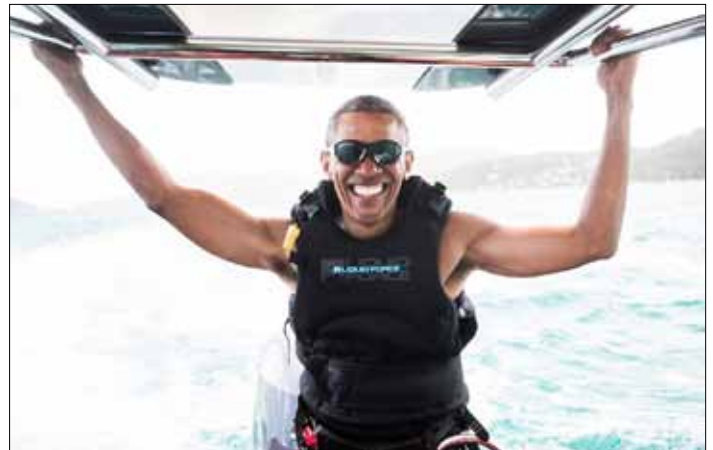
Barack Obama, eksprezydent USA, rozpoczął wakacje — najpierw w Kalifornii, a potem uda się na Karaiby