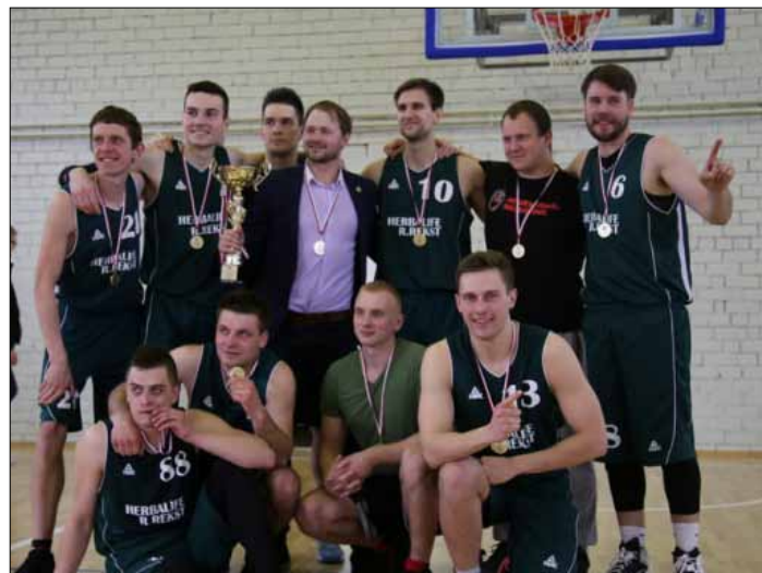
W ubiegłym roku triumfatorom w turnieju została ekipa Herbalife-Ricard Rekest

Rozgrywki siatkarzy odbędą się w podobny sposób. Dwie najlepsze ekipy z dwóch grup awansują do ćwierć-