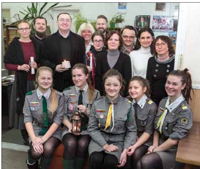
Harcerki ZHPnL zawitały do redakcji z Betlejemskim Świąteczkiem Pokoju