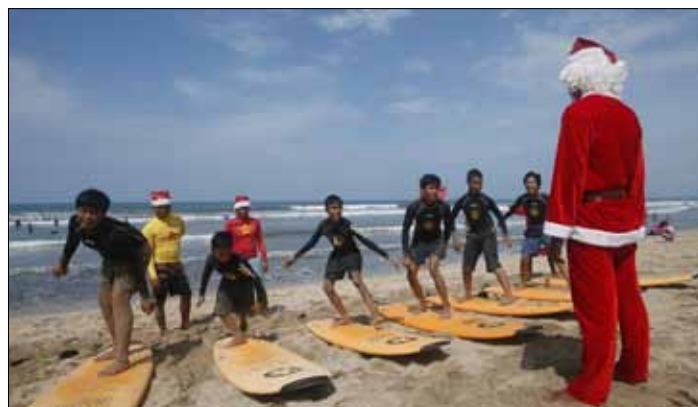
Na Wyspie Bali mężczyzna przebrany za Świętego Mikołaja uczy osierocone dzieci surfowania na deskach