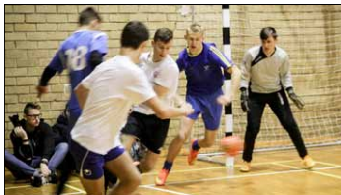
W fazie grupowej turnieju wszystkie zespoły toczyły zażarte walki o pokonanie rywali i przejście do finału

Na trzecim miejscu uplasowali się zawodnicy z Niemieża, którzy w małych finałach 2:1 okazali się lepsi od „Yeti”. Napastnik