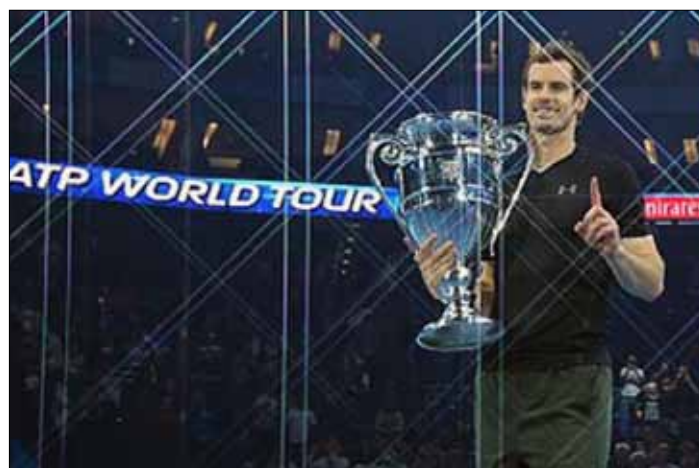
Andy Murray został uznany przez kibiców i stację BBC Sportową Osobowością 2016 roku

W tym roku zdobył złoty medal igrzysk olimpijskich w Rio de Janeiro oraz triumfował w wielkoszlemowym Wimble-