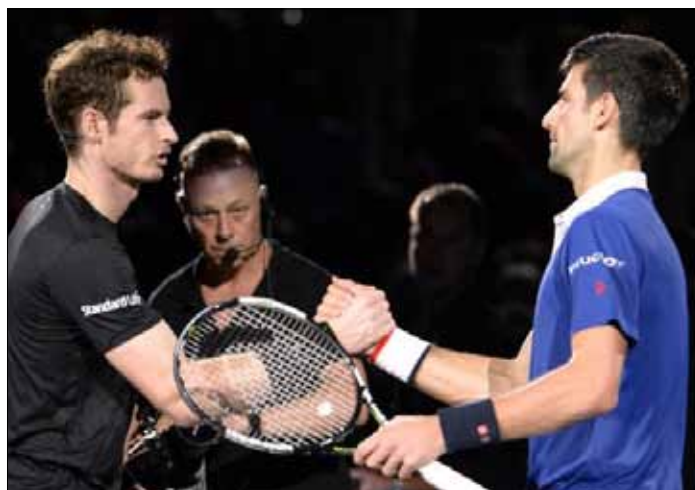
W finale Andy Murray, 29-letni Szkot, pokonał o tydzień młodszego Serba Novaka Djokovica

Z kolei Djokovic wzbogacił się łącznie o 2,60 mln. Serb miał okazję triumfować w ostatnim turnieju sezonu po raz piąty z rzędu, a szósty w ogóle. Wyrównałby tym samym rekord wszech czasów, należący do Rogera Federera. ◻