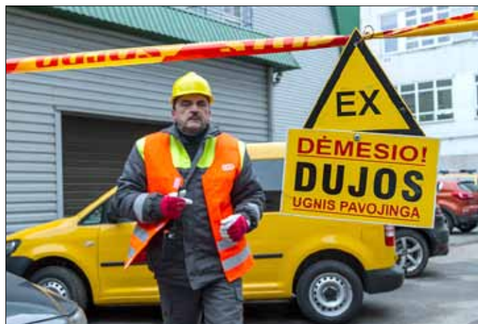
Państwowa Inspekcja Energetyki i spółka energetyczna ESO, zorganizowały ćwiczenia awaryjne