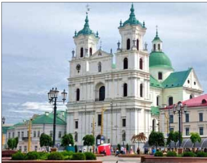
Zabytki Grodna i Grodzieńszczyzny czekają na turystów