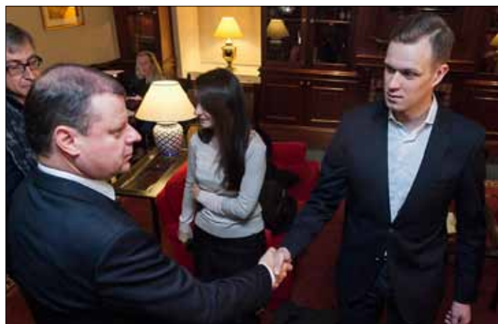
Gabrielius Landsbergis w dzień wyborów powiedział, że w negocjacji nie może być Karbauskisa

— Na wypadek podejrzewania, że poseł jest niezupełnie trzeźwy, musiałaby istnieć procedura, pozwalająca sprawdzić, czy rzeczywiście jest on pod wpływem alkoholu. Nale-