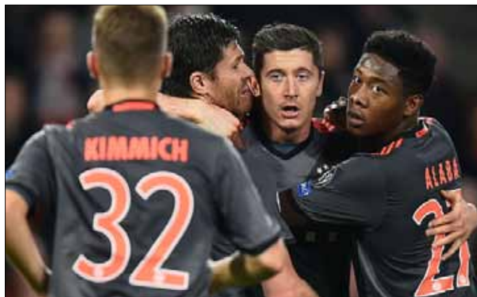
Robert Lewandowski zdobył dwie bramki, a jego Bayern Monachium pokonał na wyjeździe PSV Eindhoven 2:1