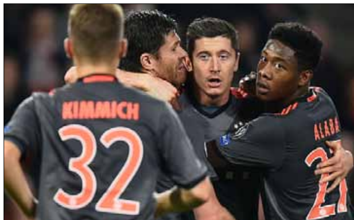
Robert Lewandowski zdobył dwie bramki, a jego Bayern Monachium pokonał na wyjeździe PSV Eindhoven 2:1