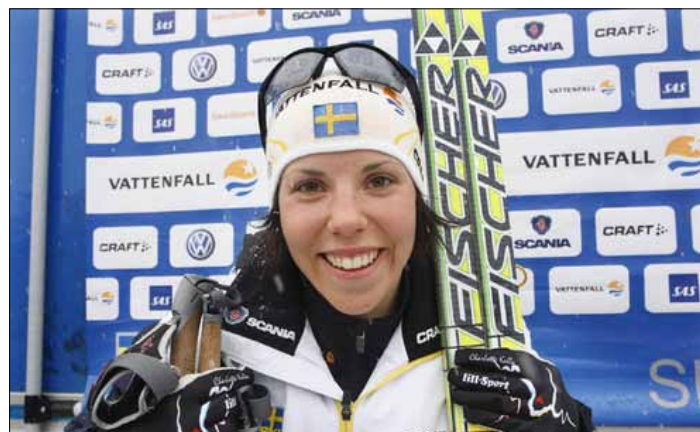
Szwedzka biegaczka Charlotte Kalla wspiera swoją rywalkę Johaug uwikłaną w dopingową aferę

Aktualnie utytułowana Norweżka jest zawieszona do 18 grudnia. Jeśli za dwa miesiące nie zapadnie ostateczna decyzja w jej sprawie, okres dyskwalifikacji zostanie przedłużony o kolejne sześćdziesiąt dni. □