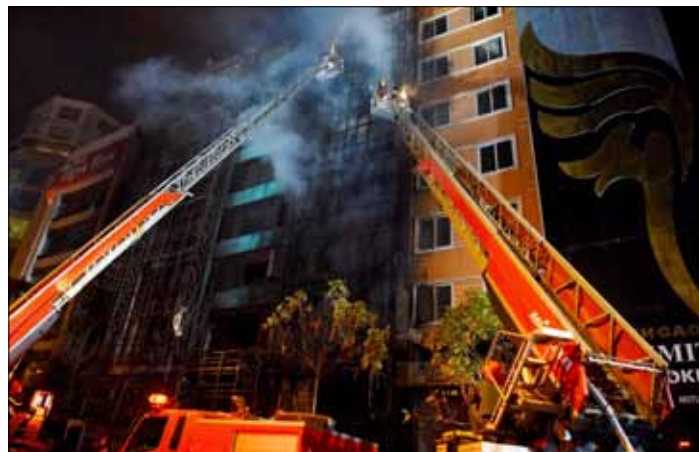
13 osób zginęło w pożarze, jaki wybuchł w barze karaoke w stolicy Wietnamu, Hanoi