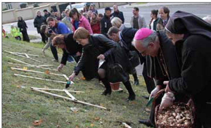
Żonkile sadzono i rok temu