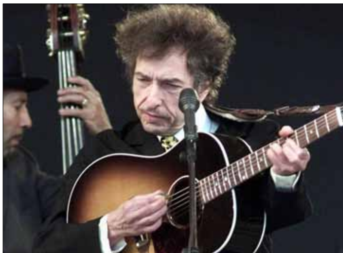
Amerikanin Bob Dylan został laureatem tegorocznej Nagrody Nobla w dziedzinie literatury