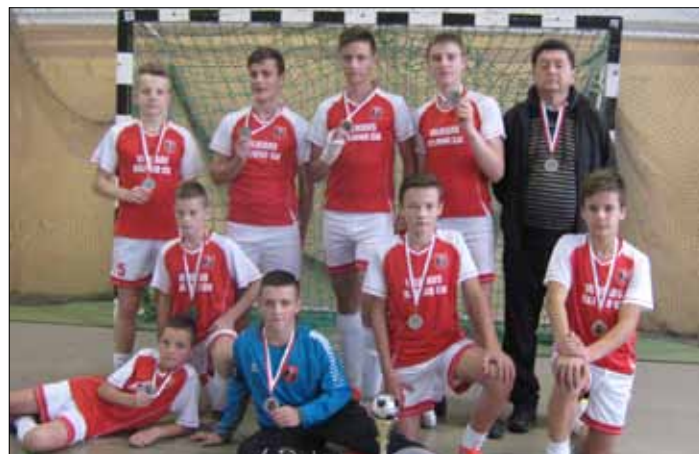
Drużyna rejonu wileńskiego składała się z piłkarzy z Rudomina, Niemieža, Niemenczyna, Mariampola i Kowalczuk