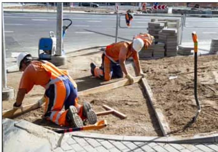
Już od dłuższego okresu pracodawcy skarżą się na brak wykwalifikowanej siły roboczej

przyciągać inwestycje do kraju, bo po jakimś czasie pracowników w ogóle nie zostanie. Potrzebne są inwestycje w oświatę. Należy szkolić specjalistów z konkretnych dziedzin, zając się szkołami zawodowymi, a nie masowo „klepać” specjalistów IT czy zarządców, których teraz jest masa. Należy też zmniejszyć podatki na pracowników, ponieważ pracodawców one bardzo drogo kosztują. Zaoszczędzone z mniejszych podatków pienią-