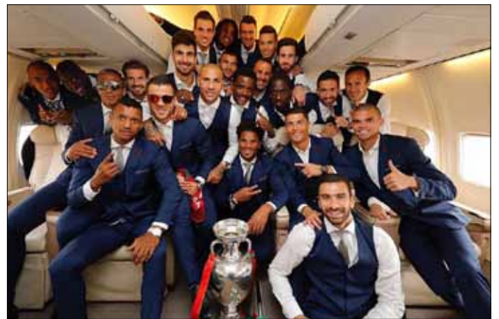
Piłkarze reprezentacji Portugalii wracają do domu po zdobyciu mistrzostwa Europy

Ekspert wskazuje, że niektórzy turyści zdecydowali się spędzić swój tegoroczny urlop w Portugalii właśnie z uwagi na sukces tego kraju w Euro. Przedstawiciele operatora międzynarodowej wyszukiwarki Hostelworld ujawnili, że w czasie turnieju poszukiwanie noclegu w tym iberyjskim kraju zwiększyło się o 9 proc. Z kolei 10 lipca, czyli w dniu wygranego przez ekipę Santosa finału, wzrosło o 24 proc. □