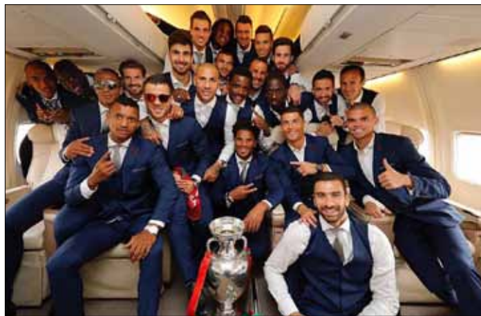
Piłkarze reprezentacji Portugalii wracają do domu po zdobyciu mistrzostwa Europy

Eksperti wskazują, że niektórzy turyści zdecydowali się spędzić swój tegoroczny urlop w Portugalii właśnie z uwagi na sukces tego kraju w Euro. Przedstawiciele operatora międzynarodowej wyszukiwarki Hostelworld ujawnili, że w czasie turnieju poszukiwanie noclegu w tym iberyjskim kraju zwiększyło się o 9 proc. Z kolei 10 lipca, czyli w dniu wygranego przez ekipę Santosa finału, wzrosło o 24 proc. □