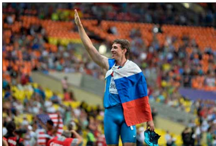
Rosyjscy lekkoatleci na pewno nie pojadą do Brazylii, by rywalizować tam o medale

MKOl, analizując sytuację, doszedł na początku lipca do wniosku, że na ewentualny start można zezwolić tym z „czystych” lekkoatletów Sbornej,