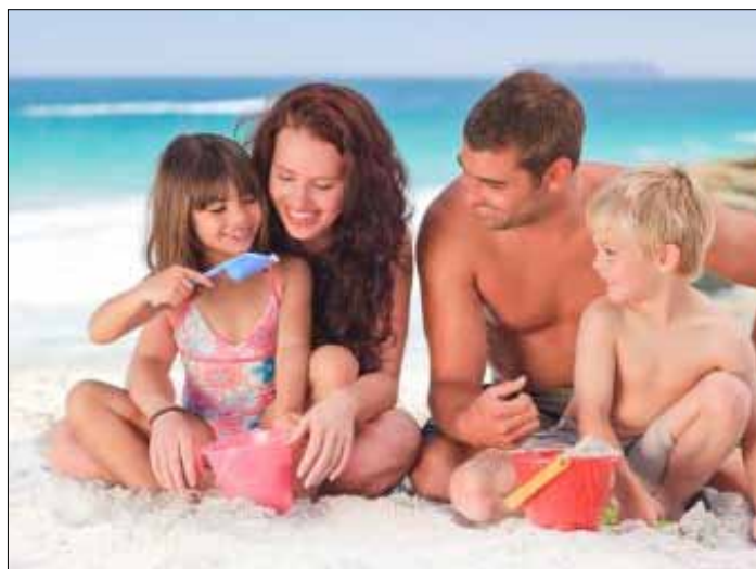
Wyjazd nad morze to... przyjazd po zdrowie!

Wyjazd nad Bałtyk polecany jest wszystkim dzieciom, a już szczególnie chorowitym i alergikom. Jeśli masz taką możliwość, niech dzieci spędzą tu miesiąc (z tobą, tatą, babcią). Zobaczysz efekt jesienia! ☐