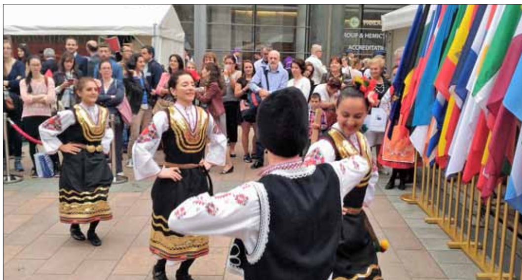
Bruksela przywitała odwiedzających bardzo gościnnie. W czasie festynu każdy z krajów członkowskich UE częstował swoimi potrawami i prezentował folklor