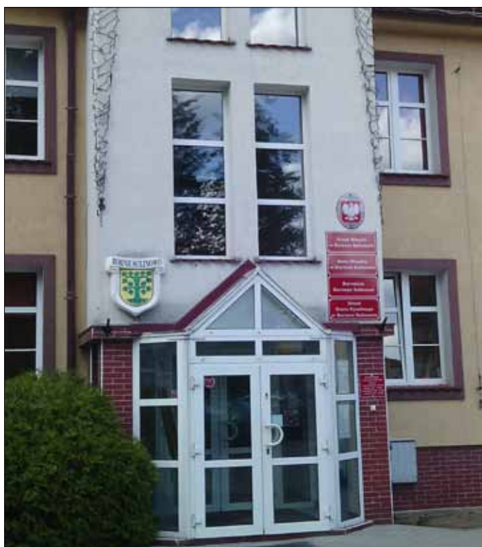
Ratusz w Bornem Sulinowie, w którym niegdyś rezydowali agenci KGB. W miasteczku powstanie skansen sowieckich pomników