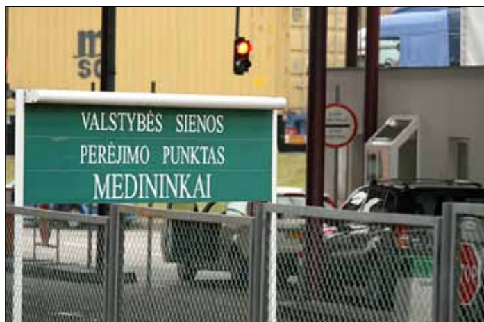
Od 1 września wywóz paliwa z Białorusi na Litwę nie będzie ograniczany

— Mam stałą pracę. Do tego dorabiam jeżdżąc na Białoruś po paliwo. Przywożę sobie i czasami zostaje mi na sprzedaż. Kupiłem specjalnie samochód z większym bakiem, żeby zmieścić jak najwięcej paliwa. Po odliczeniu na drogę z jednej podróży zostaje mi około 30 euro. To już jakiś dodatek do mojej minimalnej wypłaty. Od 1 września będę mógł jeździć częściej i mam nadzieję, że na Białorusi paliwo stanieje i