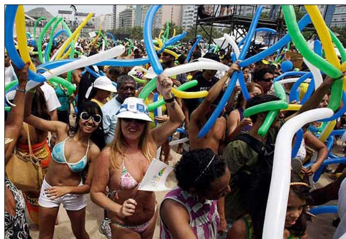
Mieszkańcy Argentyny, którzy wcześniej z euforią cieszyli się z igrzysk w ich kraju, są coraz to mniej zadowoleni

Instytut Datafolha pytał o igrzyska 2 792 osób w całej Brazylii w dniach 14 i 15 lipca. Margines błędu oceniono na 2 procent. □