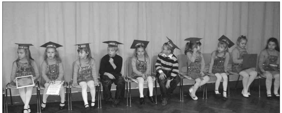
Pierwszacy przyrzekli, że będą dobrze i pilnie się uczyć oraz sumiennie wypełniać wszystkie obowiązki