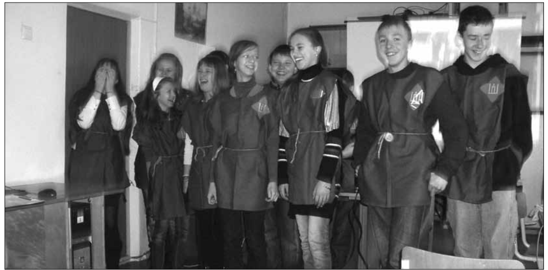
Uczniowie mieli możliwość wykazania się wiedzą z historii

Za każdą poprawną odpowiedź dostawaliśmy małą nagrodę. Mieliśmy także możliwość wykazać się zdolnościami matematycznymi. Podzieliliśmy się na trzy drużyny: dzikie koty (dziewczyny), wściekłe króliki (chłopcy), normalni rodzice (rodzice). Nauczyciel rozdał nam kartki z liczbami, które musieliśmy pokazać bez słów.