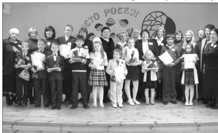
Laureaci konkursu recytatorskiego wraz z nauczycielami