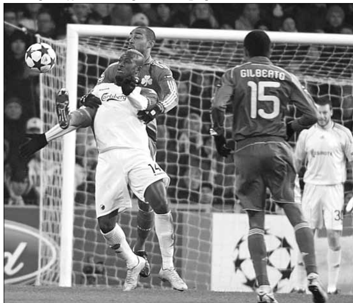
Piłkarze FC Kopenhaga dzięki zwycięstwu nad Panathinaikos Ateny awansowali do 1/8 finału Ligi Mistrzów

Najważniejszym wydarzeniem spotkania z Valencią był gol dla gości Pablo Hernandezza w 32. minucie gry. Tym samym ekipa z Old Trafford straciła szansę, by zostać