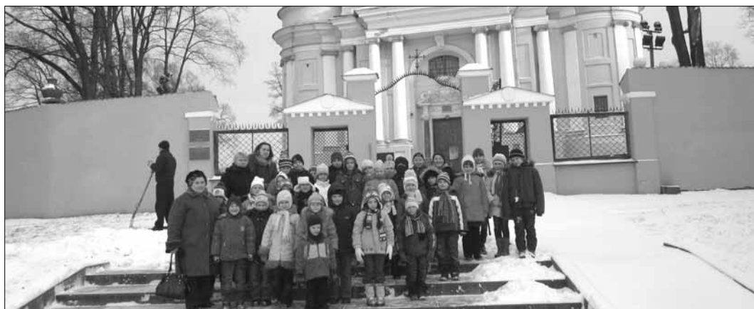
Podczas pobytu w Wilnie zwiedziliśmy również kościoły

Zwiedzanie planetarium wywarło na wszystkich ogrom-