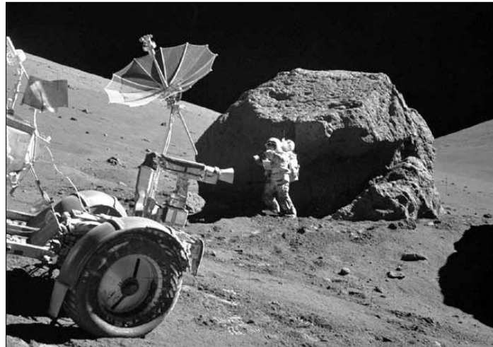
Pierwsze zdjęcia wskazujące na istnienie płatowych skarp powstały już podczas misji Apollo w latach sześćdziesiątych

Zmiana rozmiaru sąsiadujących ze sobą skał i obszarów będzie powodować naprężenia, pęknięcie i powstawanie charak-