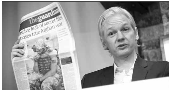
Założyciel Wikileaks Julian Assange przekonany jest, że zarzuty przeciw niemu podyktowane są względami politycznymi

„To człowiek, który szczerze wierzy w to, że ujawnienie państwowych tajemnic otworzy świat i uczyni go lepszym. Wikileaks to wielkie lustro, które