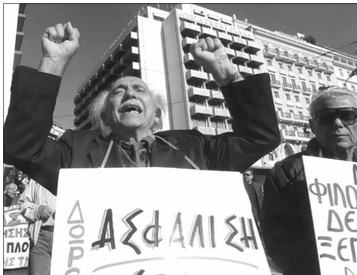
Protesty greckich emerytów towarzyszyły wczorajszej wizycie szefa Międzynarodowego Funduszu Walutowego w Atenach