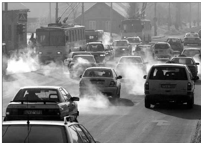
Niejakościowe paliwo jest niebezpieczne dla silników