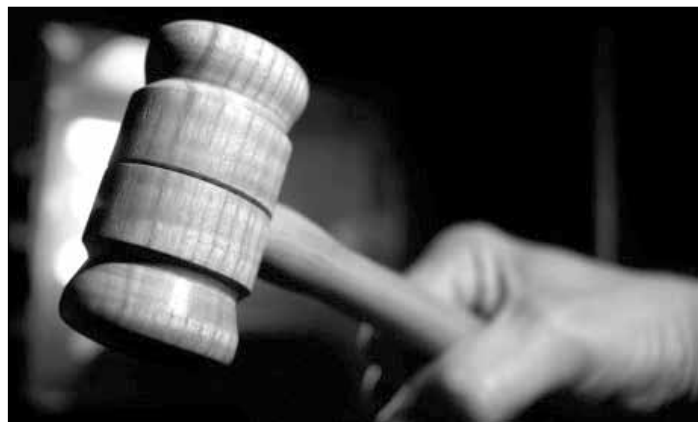
Brytyjski sąd oskarżył Litwina o nieumyślne zabójstwo chłopca i zadanie ciężkich obrażeń

Następnie, jak powiedział prokurator, Litwini powrócili, aby odemścić, ale znaleźli tylko nietrzeźwego Loudera i dwie dziewczyny, które wcześniej opuściły swych kolegów i ruszyły w stronę tunelu kolejowego. Tam nastolatek został śmiertelny pobity, a broniącej go Griffiths złamano rękę. □